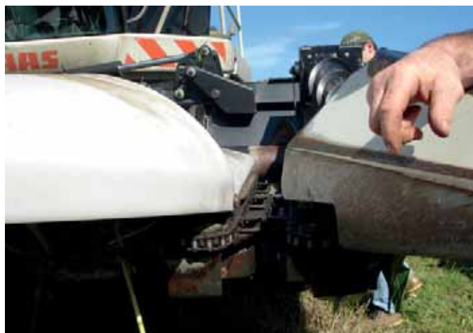
Vue d'ensemble du chantier de récolte du maïs épi et détail du bec cueilleur du maïs