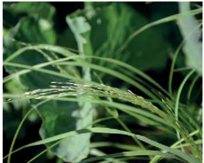
Inflorescence de teff

Pour les engrais verts pluriannuels on retrouve principalement le trèfle, les prairies de fauche et les mélanges de prairie + trèfle rouge.