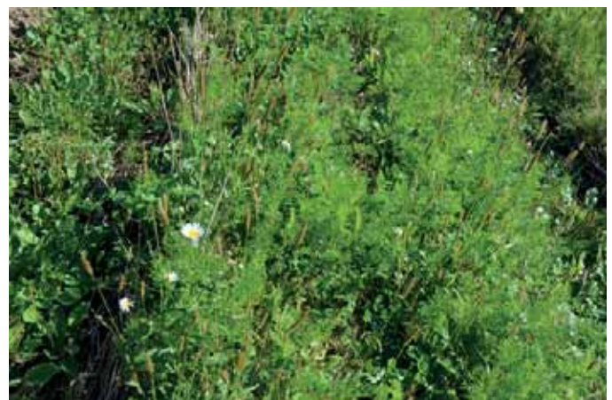
Carotte semée dans un chaume de seigle

Pour les engrais verts de saison, là aussi le choix peut être large, mono espèce ou en mélange. On retrouve le trèfle incarnat, le trèfle d'Alexandrie, le teff (céréale d'Éthiopie ayant des propriétés allélopathiques comme le sarrasin), le pois, la féverole, l'avoine, le sarrasin, la phacélie, ou encore le mélange avoine, pois, féverole au printemps.